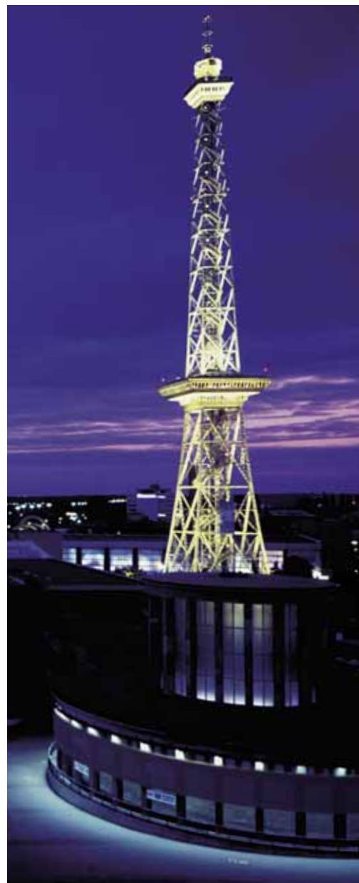
Wahrzeichen mit Tradition: Der Funkturm am Berliner Messegelände

In Berlin-Adlershof nutzt und ergänzt Deutschlands vielseitigster Medienstandort die kreative Umgebung von Berlins größtem Technologiepark. In 650 Medienunternehmen arbeiten mehr als 1.200 Menschen und profitieren von den Synergien des Standorts. Die Vielfalt und der ideale Mix der Firmen machen erfolgreiche und effiziente Produktionen möglich.